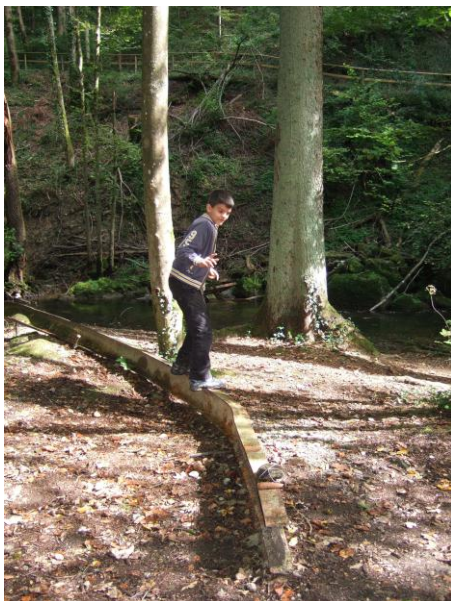
Balancieren braucht grosse Konzentration