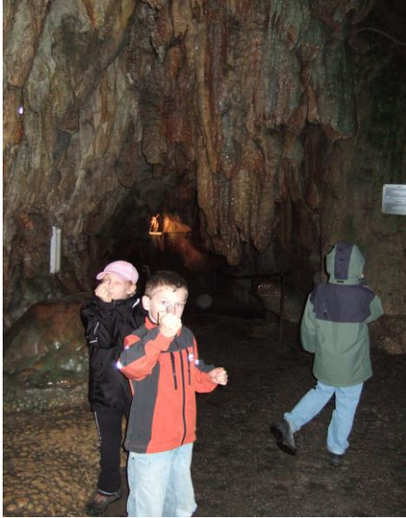
Mittwoch: Ausflug in die Höllgrotte in Baar